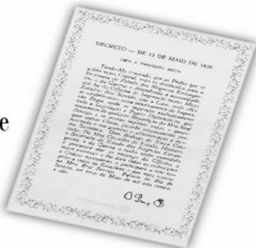
Réplica do Decreto de 13 de maio de 1808.

...a Imprensa Nacional foi criada através do Decreto de 13 de maio de 1808, assinado pelo Príncipe Regente D. João, com o nome de Impressão Régia e seu objetivo era o de imprimir, com exclusividade, todos os atos normativos e administrativos oficiais do governo?