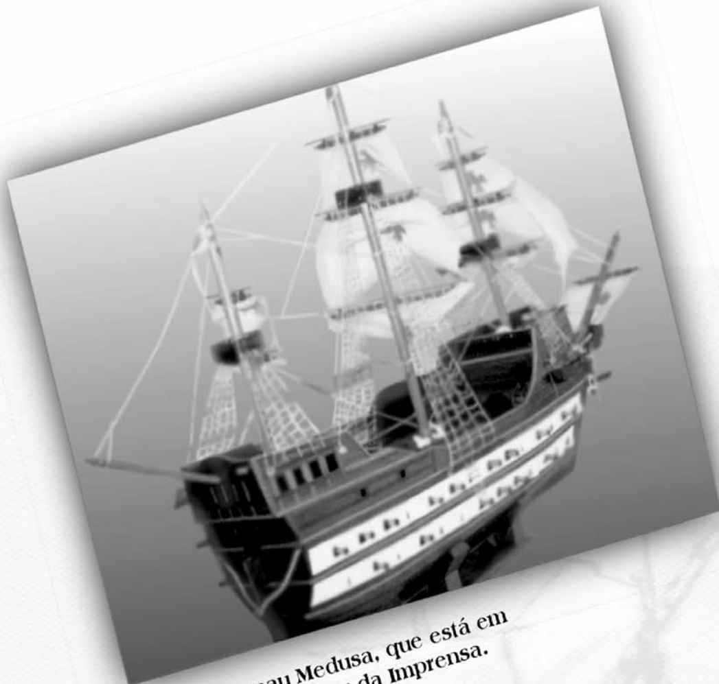
Réplica da nau Medusa, que está em exposição no Museu da Imprensa.

...os primeiros prelos da Imprensa Régia vieram nos porões da nau Medusa, quando da transferência da Corte Portuguesa para o Brasil, trazendo à colônia inestimáveis benefícios, dentre os quais, a criação de uma Imprensa Oficial?